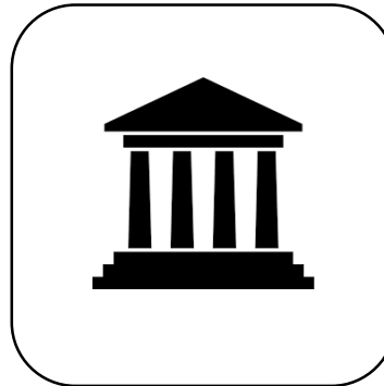
Øvrige interessenter og virksomheder