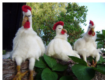
(Filthøns af Anne-Grethe Rødvig)

Du kan få flere oplysninger om reglerne for stalddørssalg og indretning af produktionslokaler hos Fødevarerrådgiver Signe Folke. Tlf.: 5690 7816 eller mail: sf@bornholmslandbrug.dk